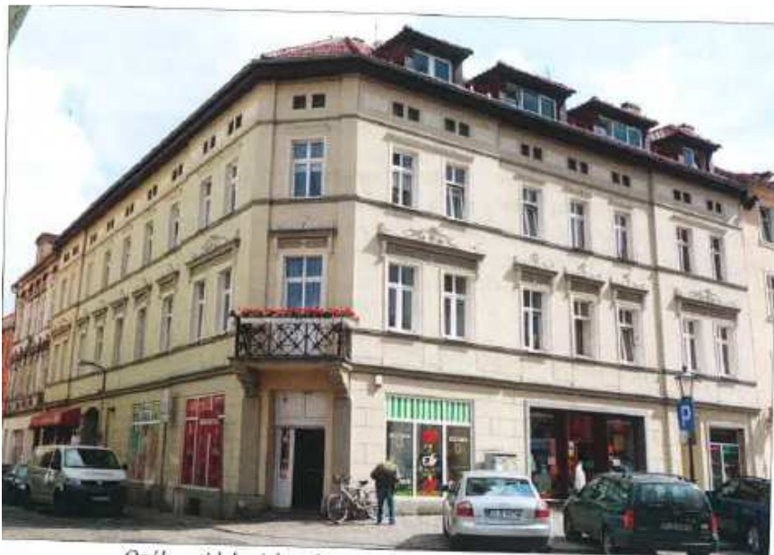
Ogólny widok wielorodzinnego budynku przy ulicy Mikołaja 1.

na sprzedaż lokalu mieszkalnego Nr 2, znajdującego się w budynku położonym w Lubaniu przy ul. Mikołaja 1 (JG1L/00028087/5) wraz z udziałem we współwłasności nieruchomości gruntowej (działka nr 28/1, AM 3, Obręb III o powierzchni 442 m 2 , JG1L/00020779/7)