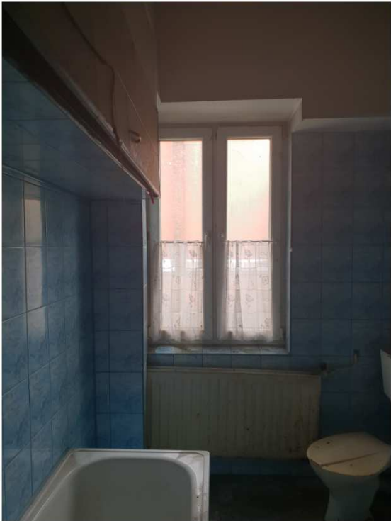
Widok wnętrza lokalu